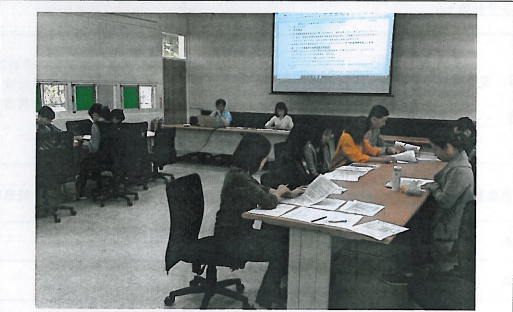
照片 2 說明：108 學年度第一學期課程發展委員會第二次會議 109.01.17 12 時 35 分 本校會議室